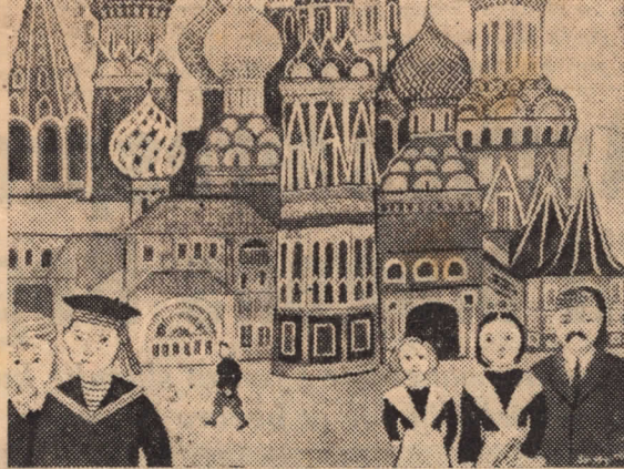
Hans Scherfig: Kreml.