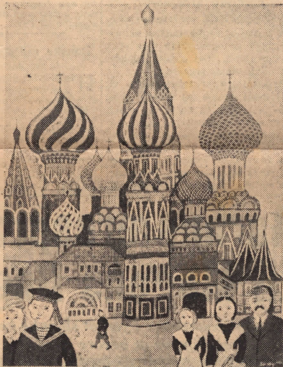
Hans Scherfig: Kreml.

gøres derved, at Victor Brockdorff i aar har faaet overladt en hel sal paa Cornerudstillingen, som i dag aabner paa Charlottenborg. Han er udstillingens midtpunkt med en retrospektiv ophængning af billeder, hvoraf de tidligste er signeret 1926, de sidste 1950. Desværre har kammeraterne gjort ham en bjørnetjeneste ved at vise ham frem paa alle leder og kanter og derved aabenbare for enhver, hvor svag han er (og altid har været) i sammenføjningerne. Ophængningen er blevet et billede paa skiftende strømninger i dansk og fransk kunst — strømninger, der nøje er registreret af en følsom kunstner, som dog kun har haft meget lidt at tilføje fra sit eget sind. Hvis sindet er det afgørende i kunst — og det er det ganske sikkert — maa Brockdorff se at finde ind til sit. Kunst paa kunst har aldrig været god kunst. Hverken naar den var anti-