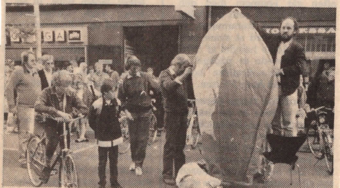
Ballonen overvandt tyngdekraften og steg til tops.