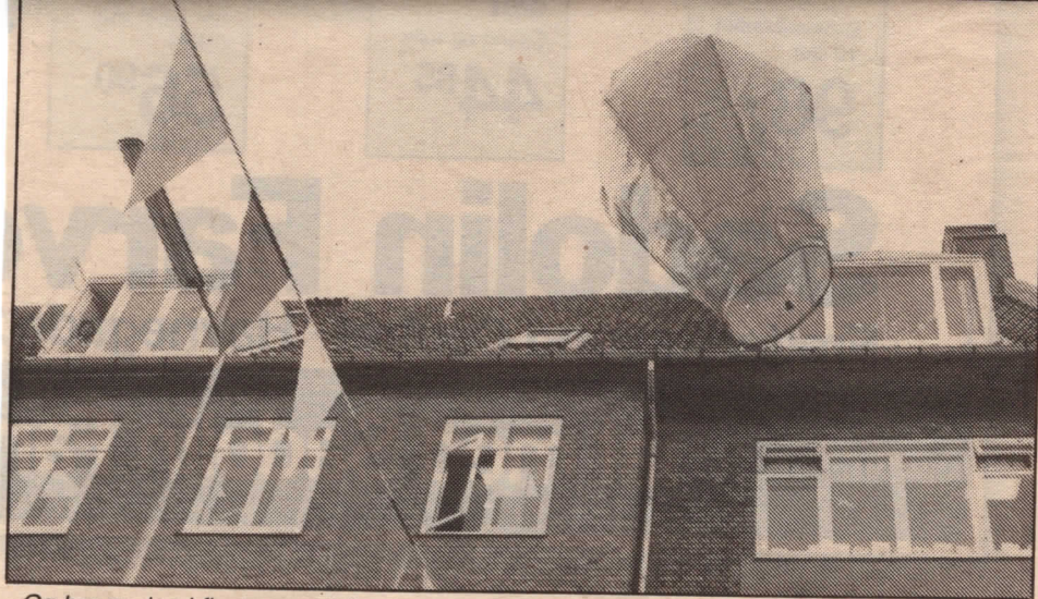
- Og her er den i flugt over bibliotekets tag, løftet af vinden og Niel Diamonds smukke musik om havmågen Jonathan, der ønsker sin frihed.