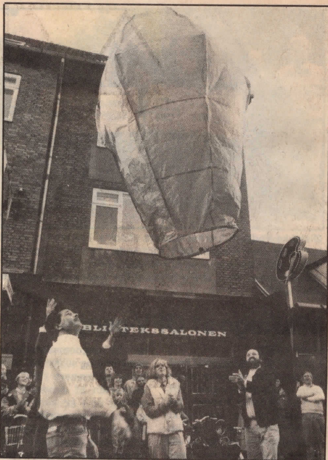
Så stiger ballonen til vejrs. Det er kunstneren forrest til venstre.