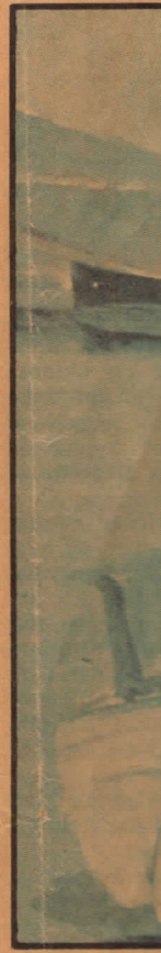
- Livet ved senere år, siger