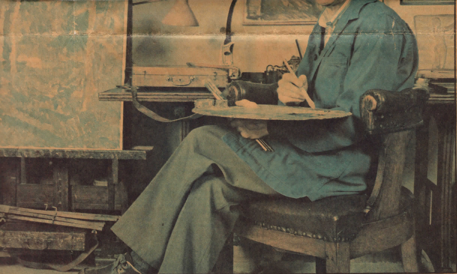
tue er tæt tapetseret med billeder og malerier. I et hjørne står et gammelt stand-ur fra slutningen af 1700-tallet som går i arv på familiens spindeside.