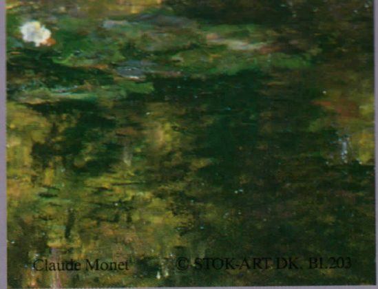
Claude Monet © STOK-ART-DK, BL203