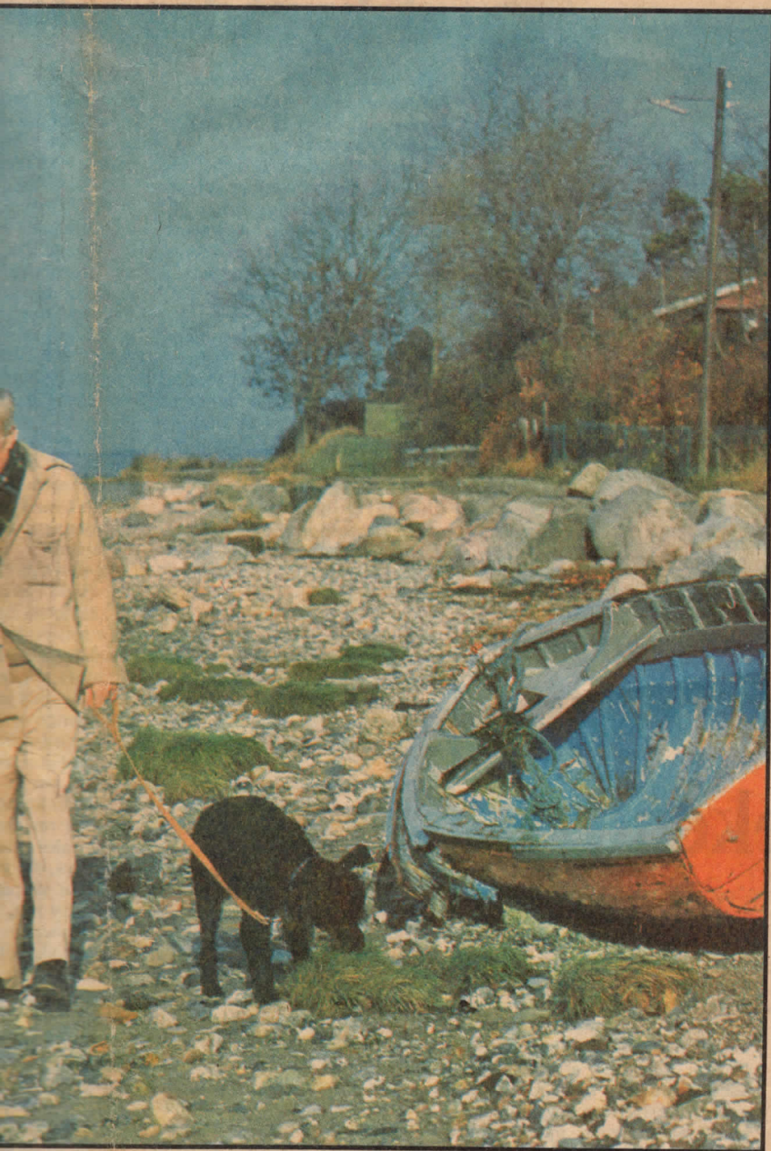
er en af barndommens tumlepladser.