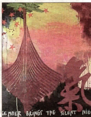
Lene Sandvangs billedmalerier, der er inspireret af street art, kan opleves i Langes Magasin i Frederikssund fra den 24. februar 2018.