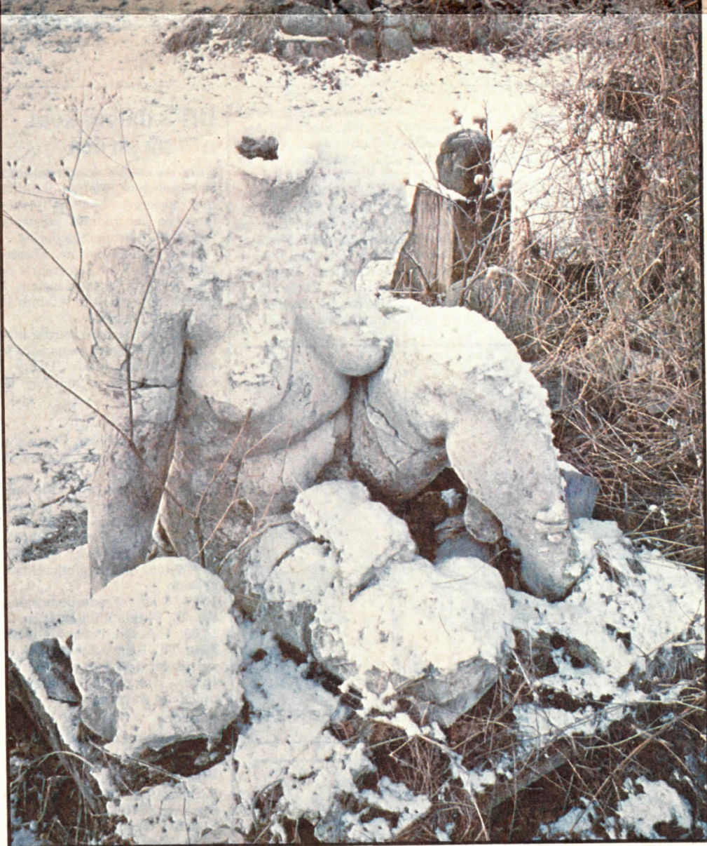
Mens billedhuggerens arbejder i sten er uforgængelige, bliver dem der formes i gips, bidt i stykker af tidens tand

I kataloget, som Frederikssund Kunstforening udgiver i