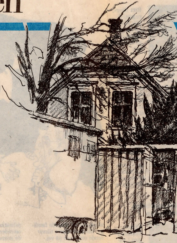
Kirtegade i Frederikssund - i baggrunden