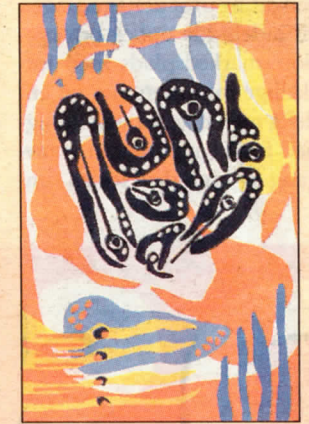
Et af Lotte Ragabs farverige billeder.

Udstillingen i Langes Magasin er åben hverdage kl. 12-16 og lørdag kl. 10-16 fra 11-16 juli .