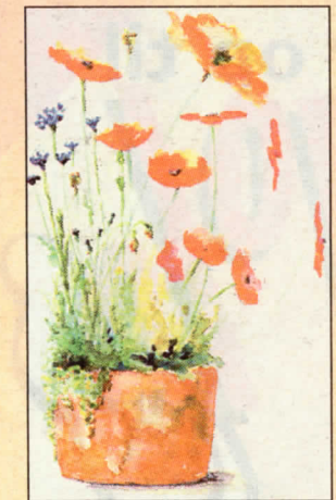
Birgith Bejder maler gerne blomsterbilleder.