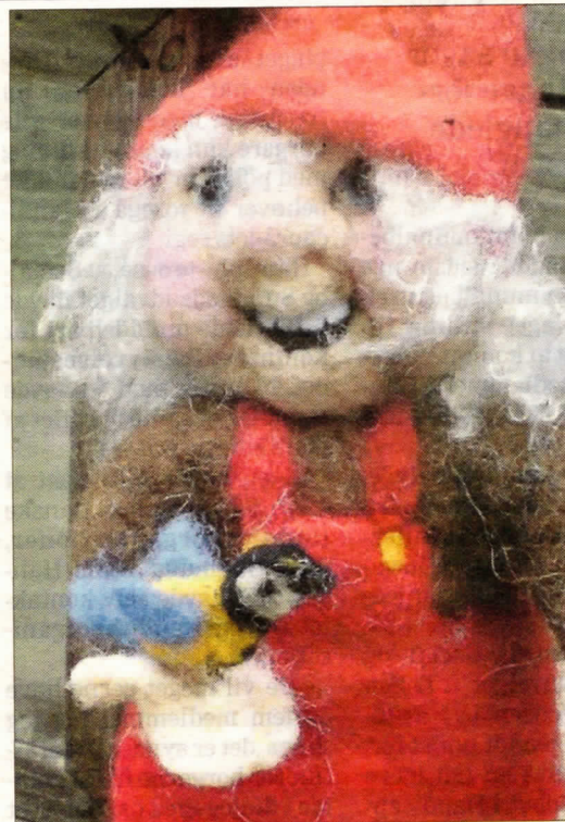
Tove Nielsen nålefilter nisser, som man vil kunne se i Form & Farvs traditionsrige julemarked i Langes Magasin i dagene 5.-7. december.