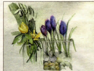
Birgith Bejders akvarel er med på forårsudstillingen i Langes Magasin.

åben i tiden fra 13.-26. april og kan ses hverdag klokken 11-17, lørdage klokken 10-14 og søn-, og helligdage klokken 11.-15.