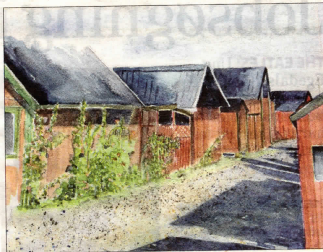
Kunstnerne fra Form & Farv udstiller i Langes Magasin fra den 20.-30. april.

Der er fernisering tirsdag den 19. april klokken 17-19, og udstillingen kan ses på hverdage fra klokken 11-17, lørdag 10-14, søndag fra 11-15.