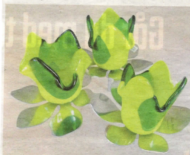
Fyrfadsstager bliver til blomsterkunst når der er forårsudstilling i Langes Magasin.