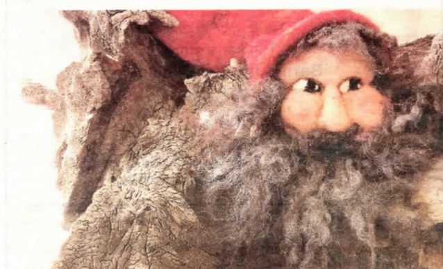
Så er der igen julemarked hos Form&Farv.