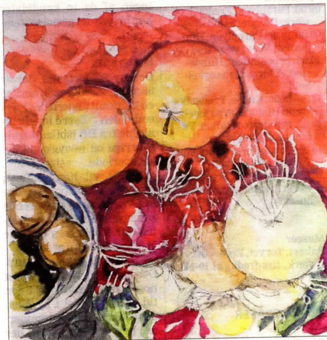
Karen Swenssons stilleben er med i Form og Farvs forårsudstilling i Langes Magasin i Frederikssund fra 3.-14. april.