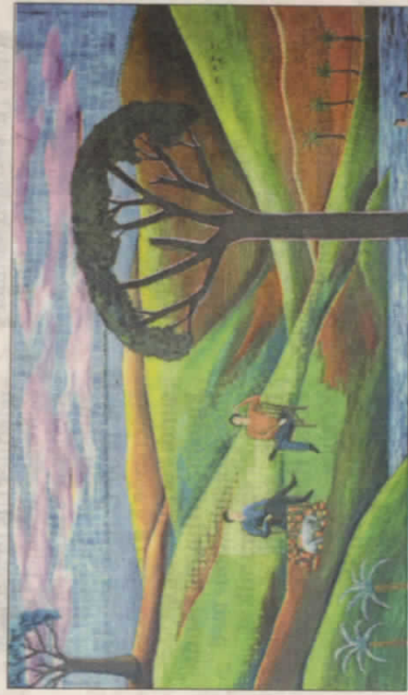
Caroline Krabbe, der har malet dette værk, maler ofte landskaber.