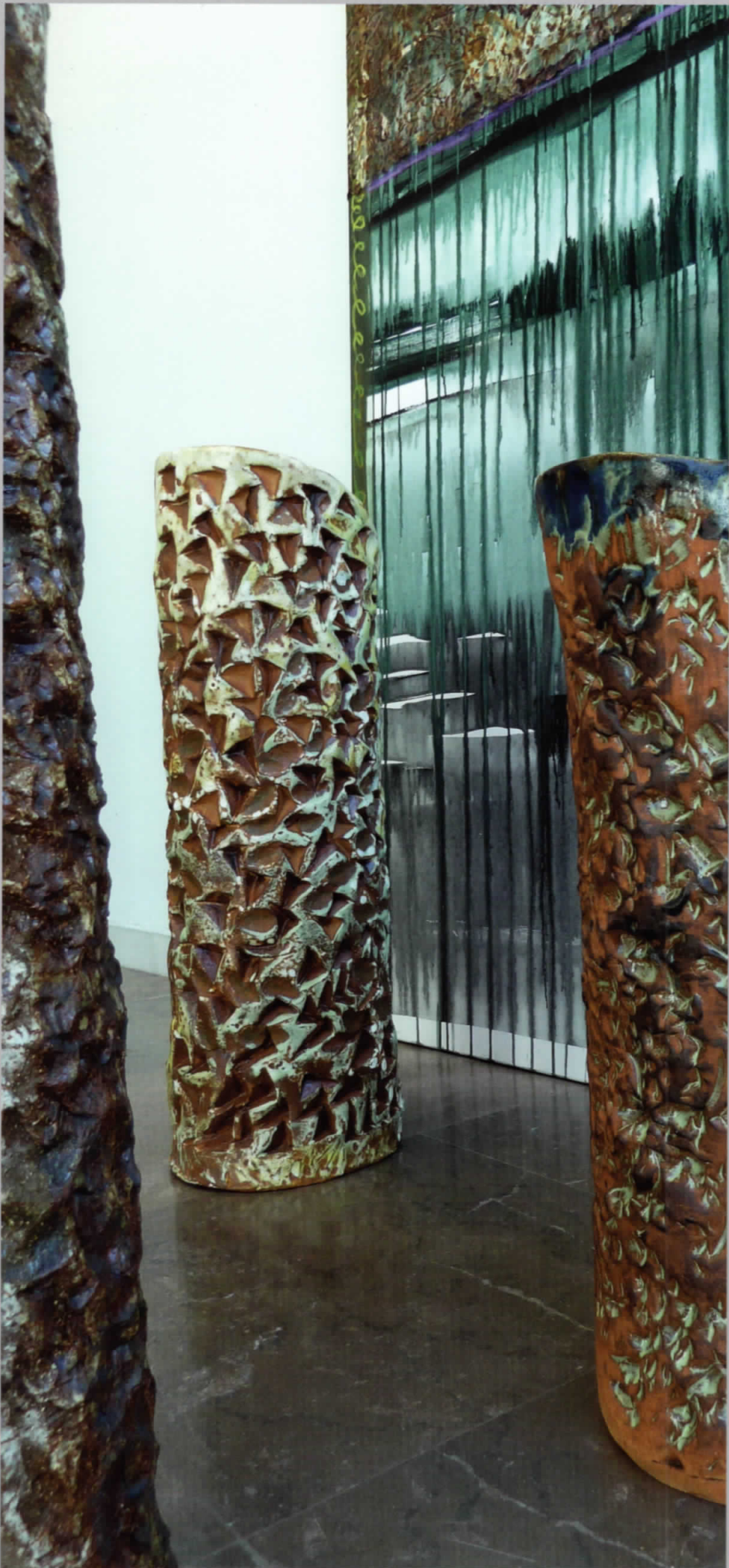
DORTHE STEENBUCH KRABBE