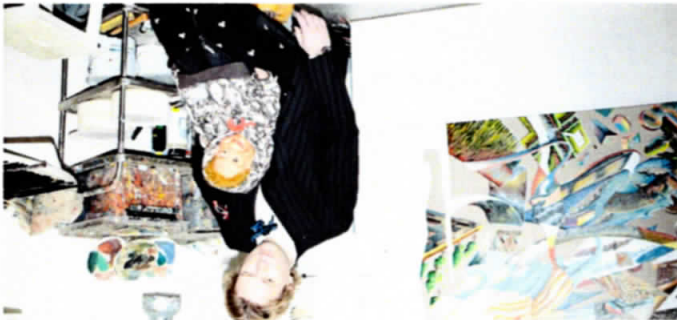
Mød kunstner Martin Bigum

FOREDRAG i Arken med multikunstner Martin Bigum